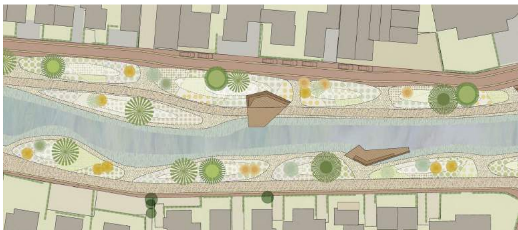
Het ontwerp bij De Brink