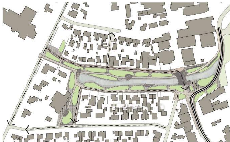
Rijrichtingen nieuwe situatie

Voor een aantal van de omwonenden blijft de vraag of de inrichting voldoende recht doet aan de hoeveelheid autoverkeer en parkeerders (denk met name aan de functie van het postkantoor). Een ander bezwaar is dat de weg van de Brink Noord dichterbij de huizen komt met mogelijke bijbehorende overlast (door verdwijnen van het trottoir). Ook over de wegomlegging alsmede het verdwijnen van parkeerplaatsen bij het makelaarskantoor is niet iedereen het eens.